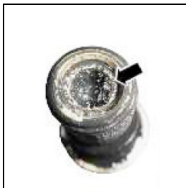
Sieb in Hohl-schraube der Öl-zulaufleitung zuge-setzt

Folgen: Leistungsverlust und/oder starke Rauchentwicklung sowie verstärkte Laufgeräusche des Turboladers!