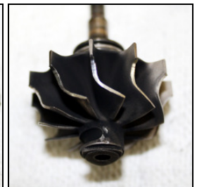
Turbinenrad an Turbinenge-häuse an-gelaufen