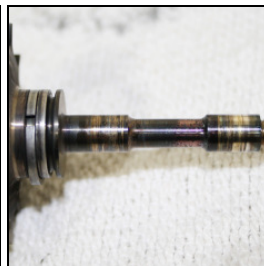
Lagerstellen der Welle be-schä-digt durch Öl-mangel